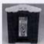
消火用水が入ったバケツ