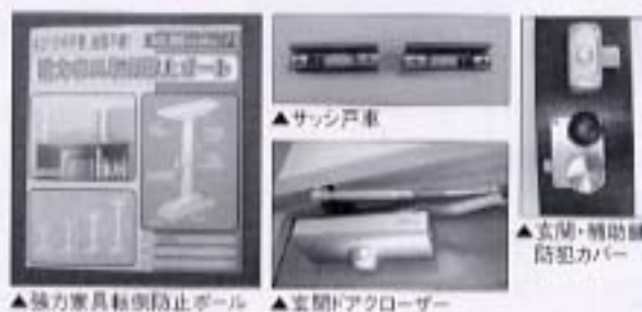
▲強力家具転倒防止ボール ▲玄関ドアクローザー