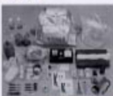
避難持ち出し品の例