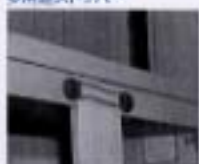
多用型ストッパー